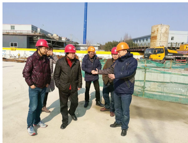
图为北部供水保障工程工地